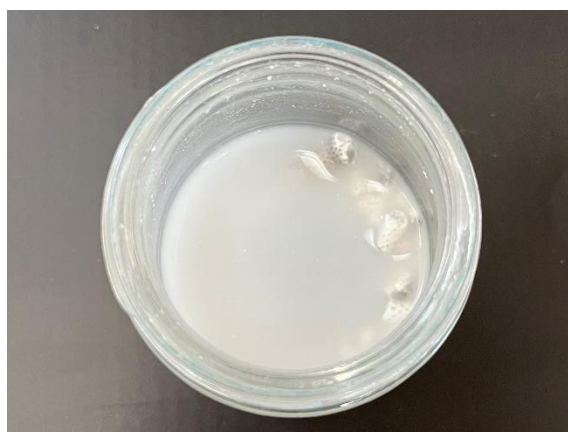
學生透過手做了解背後的生活科學。